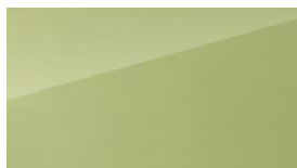
Lime green žalsva