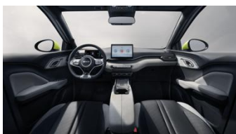
Juoda ir pilka