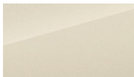
Apricity white kreminė balta