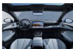
Tahiti blue mėlyna