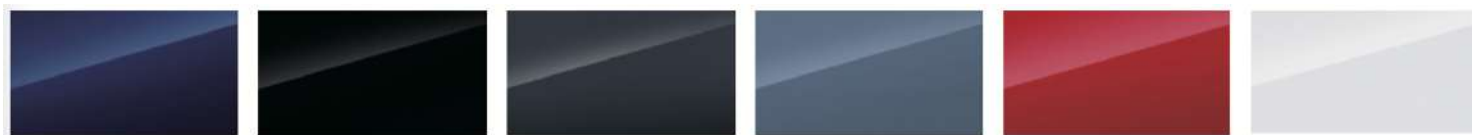
Iris blue, tamsiai mėlyna