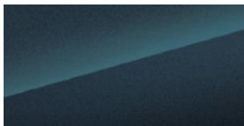
Midnight blue mėlyna