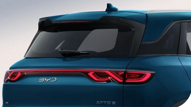
Mobius žiedo formos sėkmę simbolizuojantys galiniai žibintai